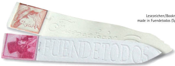
Lesezeichen/Bookmark, made in Fuentetodos (Spain)

The office and Internet qualifying courses have shown that, by means of a suitably adapted training programme, specialised and demanding occupational fields such as the design and processing of web sites can also be made accessible for disadvantaged individuals with mental health problems.