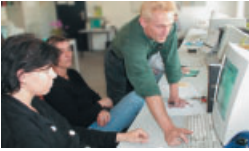
Training SPEKTRUM GmbH

Zwar konnten sich nicht alle Teilnehmer/innen eine Beschäftigungsperspektive bei Firmen im Web- oder Medienbereich konkret erarbeiten. Aufgrund der erworbenen IT-Qualifikation haben sich aber deren Wettbewerbschancen für